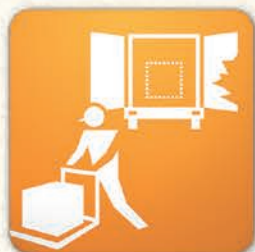
輸送中の盗難 (置き忘れを含む)

盗難・火災等偶然かつ外来的な事故により損害を被った場合に 保険金をお支払いします。